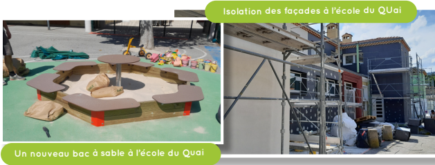
Isolation des façades à l'école du Quai

Comme chaque année pendant la période estivale, les écoles (Brémondrières et Quai) bénéficient de travaux d'amélioration et d'embellissement. Les services techniques ont été pleinement mobilisés pour réaliser plusieurs chantiers à l'intérieur des bâtiments, afin de faciliter la vie quotidienne des élèves et des équipes pédagogiques. Après l'école des Brémondrières, c'est maintenant au tour de l'école du Quai de bénéficier de l'isolation des façades extérieures et du changement des huisseries afin d'améliorer l'efficacité énergétique.