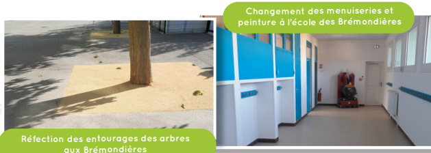
Changement des menuiseries et peinture à l'école des Brémondrières