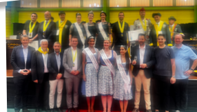
Salon des vins et de la gastronomie